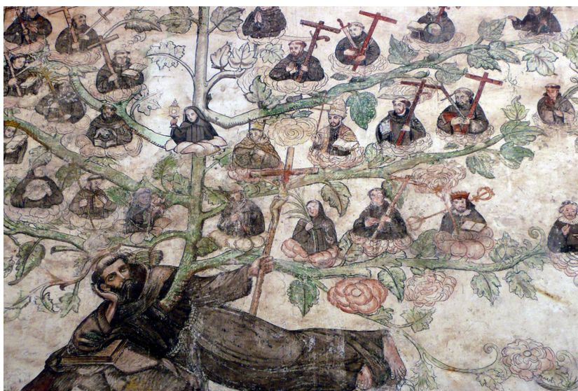
Pintura mural en la portería del exconvento franciscano de Zinacantepec, Edo. de México.

del convento franciscano de Zinacantepec, en el Estado de México, o en el convento de Cuilapan, en Oaxaca, donde se aprecia el simbólico árbol de la orden dominica.