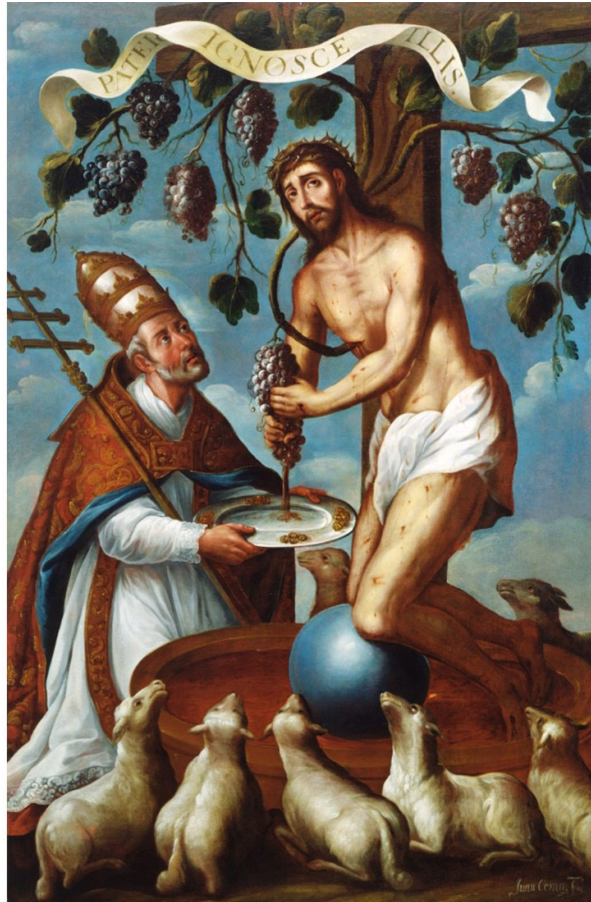
Cristo en el lagar místico. Pintó Juan Correa. Museo de Arte de Denver. https://www.archdaily.mx/mx/883954/museo-de-arte-de-denver-studio-libes-kind

Es el propio Salvador que presiona las uvas para que el líquido que mana sea recogido en un recipiente que sostiene san Pedro quien viste el atuendo de sumo pontífice, así lo indica la tiara que sostiene en su cabeza y el báculo con la triple cruz. Es innegable la simbología salvífica que representó el pintor en esta obra, con los fieles - las ovejas - que se acercan a beber del líquido santísimo y san Pedro, como cabeza de la Iglesia recibiendo de Cristo mismo su poder, que como sumo sacerdote, podrá en el sacrificio de la misa transformar